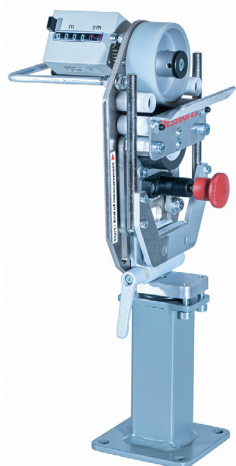
Abb. 1 MESSBOI 25 mit Sockel und Handgriff

Mobil als Handgerät oder stationär einsetzbar