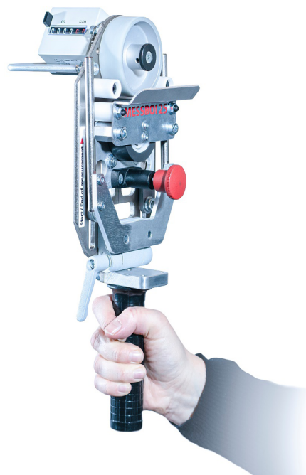
Abb. 3 MESSBOI 25 mit Handgriff