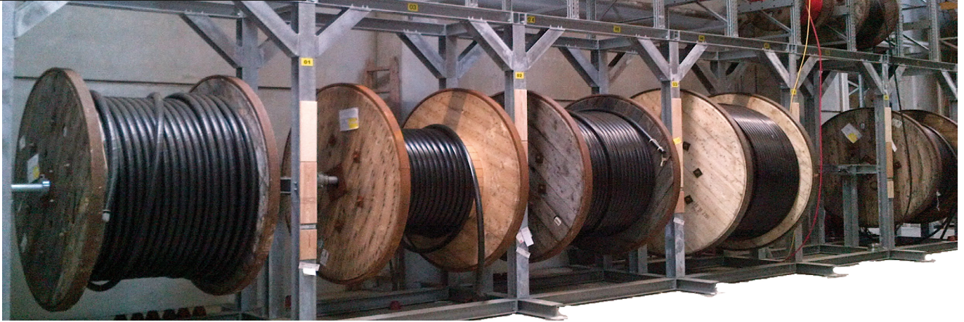
Abb. 1 ABROL Schwerlasttrommellager und Abwickelsystem mit LAGROL kombiniert