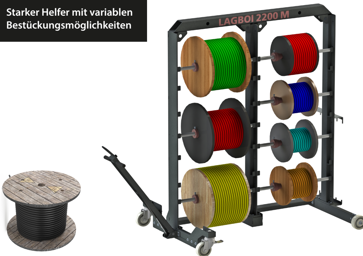
Abb. 1 LAGBOI 2200 M

Starker Helfer mit variablen Bestückungsmöglichkeiten