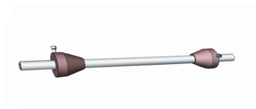
Abb. 3 Trommelachse mit Zentrierkonen