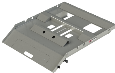
Abb. 2 TROMSTOP, Aufrollrampe ausgeklappt