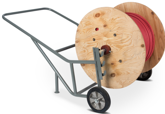
Abb. 1 TROMCAR 1000