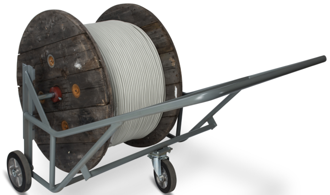
Abb. 2 TROMCAR 1250