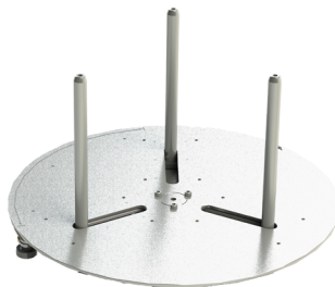
Abb. 3 RINGFIX 480 Abwickelteller