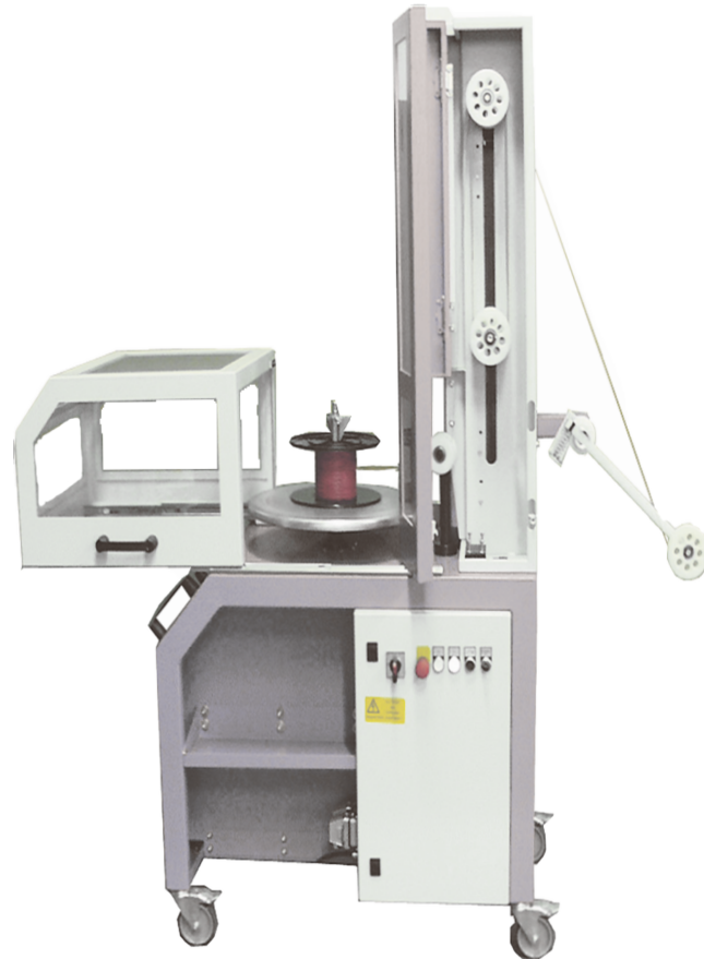
Abb. 1 SPULFIX 480 mit geöffneter Schutzhaube

Perfekte Ergänzung zu Verarbeitungsmaschinen